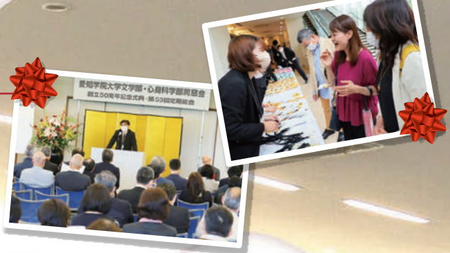
愛知学院大学文学部・心身科学部同窓会 創立50周年記念式典・第50回定期総会

ランチタイム中からアトラクションが始まり、学生クラブによる発表や文学部博物館、坐禅堂、心理学実験室、給食経営管理実習室などの学内ツアーが行われ、参加者は授業などで利用した懐かしい施設、これまで縁がなく初めて見る施設に笑顔で学内を散策されていました。